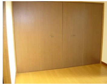
大きなクローゼット